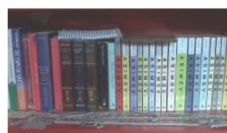
W i 12 anni: fantascienza per ragazze e ragazzi 28 marzo 2017 In "Articoli"